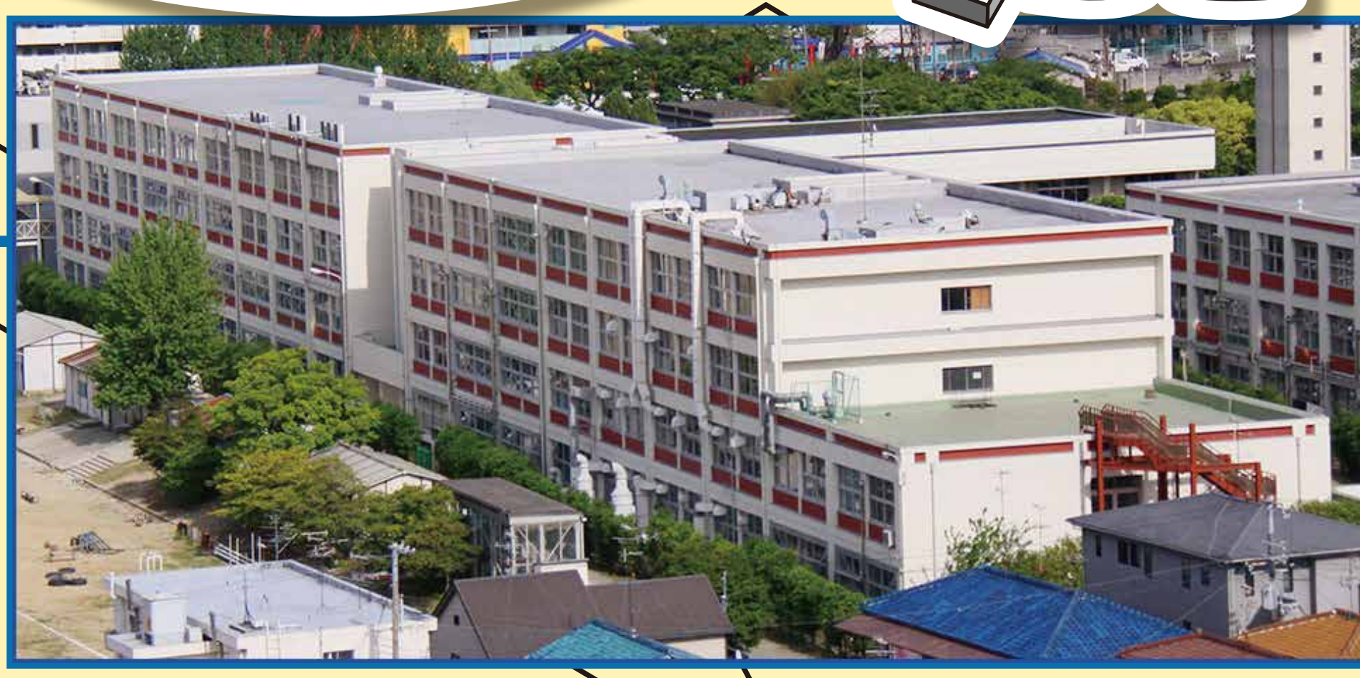
共育連携センター